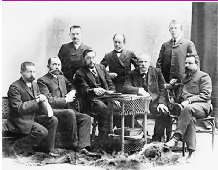
ТОМСКИЕ ПРОФЕССОРА ИСКАЛИ РЕЦЕПТ УКРЕПЛЕНИЯ НЕРВОВ ДЛЯ ДОСТИЖЕНИЯ ЖЕЛАЕМОГО

СБОР ОБЕРЖЕ, ДАВНО ИСПЫТАННЫЙ ЖИЗНЬЮ, В НАШЕ ВРЕМЯ СТАЛ ВОСТРЕБОВАННЫМ. ДЕЙСТВИТЕЛЬНО, УКРЕПЛЯЕМ НЕРВЫ - И ВПЕРЕД, К ДОСТИЖЕНИЮ ЦЕЛИ!